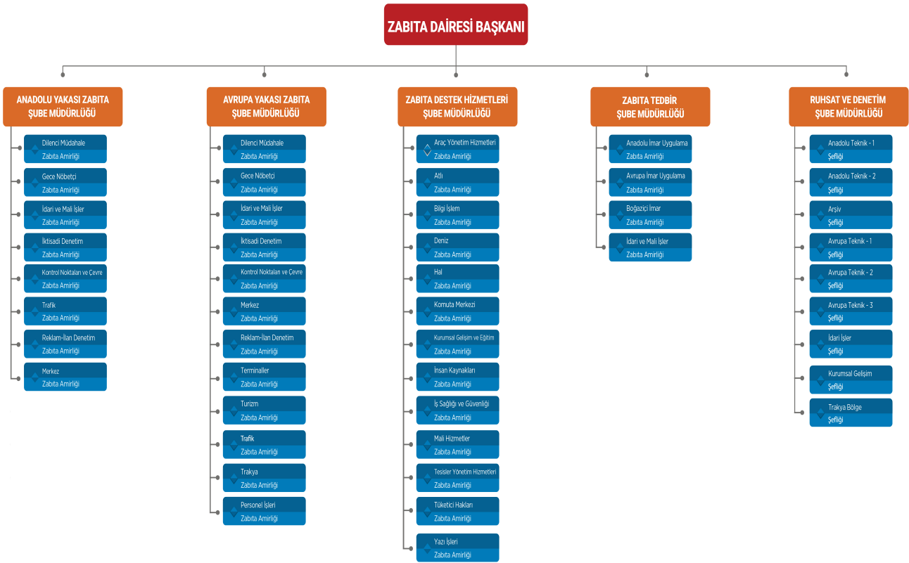
Şekil 1. Zabıta Dairesi Başkanlığı Organizasyon Şeması